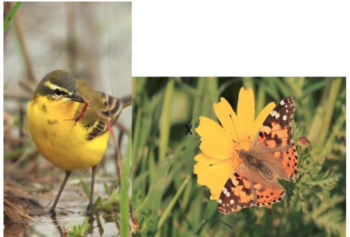
Εικόνα 9. Βλάστηση και είδη πουλιών στην παραλία Μοσχάτου.