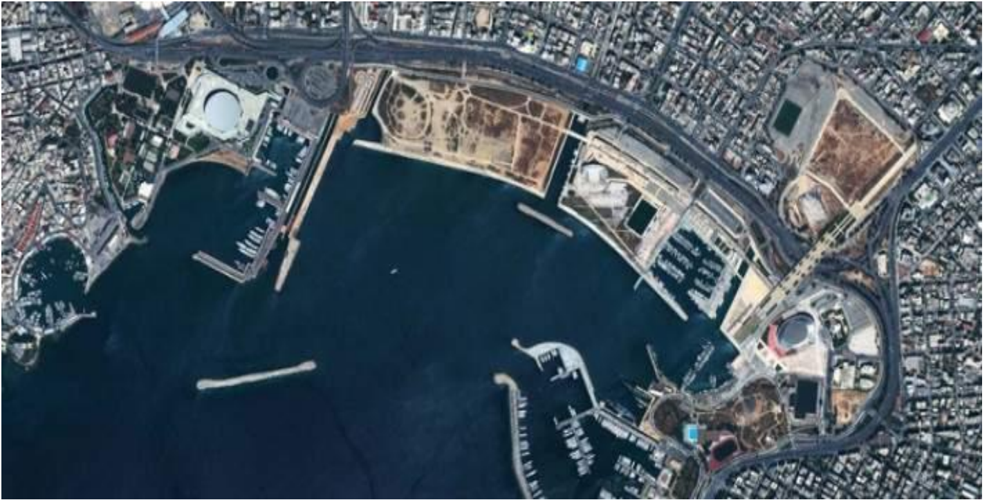
Εικόνα 3. Τα αρχικά σχέδια για την παραλία Μοσχάτου προέβλεπαν τη διαμόρφωση ενός πολύ ωραίου και περιποιημένου χώρου.