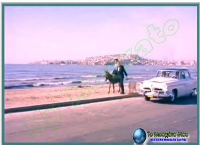
Εικόνα 12 και 13. Η παραλία Μοσχάτου το 1956 (εικόνα από την ταινία «Πρωτευουσιάνικες Περιπέτειες»).