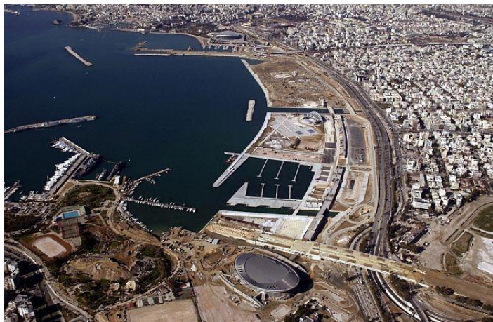
Εικόνα 14. Είναι πολύ λυπητερό μια τόσο όμορφη περιοχή να παραμένει αναξιοποίητη.

Αρχικά, η περιοχή του Μοσχάτου είχε αποκοπεί πολύ νωρίτερα από την παραλία του. Συγκεκριμένα, το