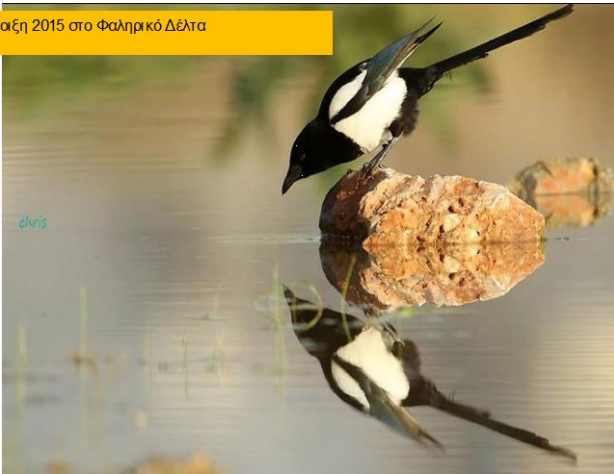
Εικόνα 8. Διάφορα είδη πουλιών εμφανίζονται αρκετά συχνά στο Δέλτα Φαλήρου.