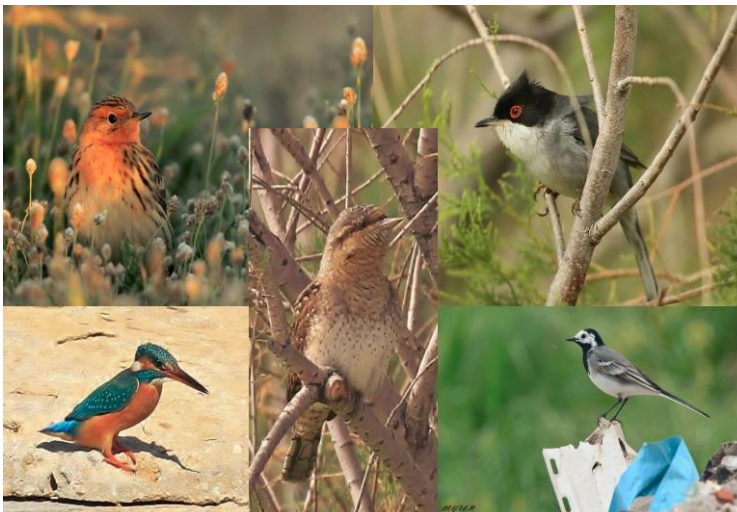
Εικόνα 5. Διάφορα είδη πουλιών που έχουν παρατηρηθεί στην περιοχή.

Η παράκτια περιοχή αποδείχθηκε ως μία όαση βιοποικιλότητας και στέγη 161 πτηνών εκ των οποίων τα περισσότερα είναι μεταναστευτικά, καθώς είναι η μοναδική άκτιστη ακτογραμμή με υγροτοπικά ενδιαυτήματα στο Λεκανοπέδιο. Επίσης οι εκβολές των ποταμών σε δελταδικό θαλάσσιο μέτωπο “τρέφοντας” την θάλασσα με πλούσια