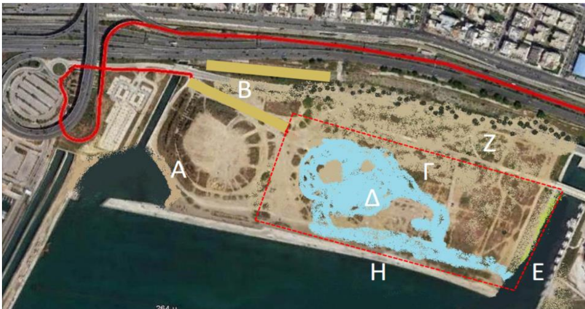
Εικόνα 2. Αρχικό σχέδιο