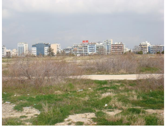
Εικόνα 17. Σήμερα ο χώρος της παραλίας Μοσχάτου μοιάζει εγκαταλελειμμένος.