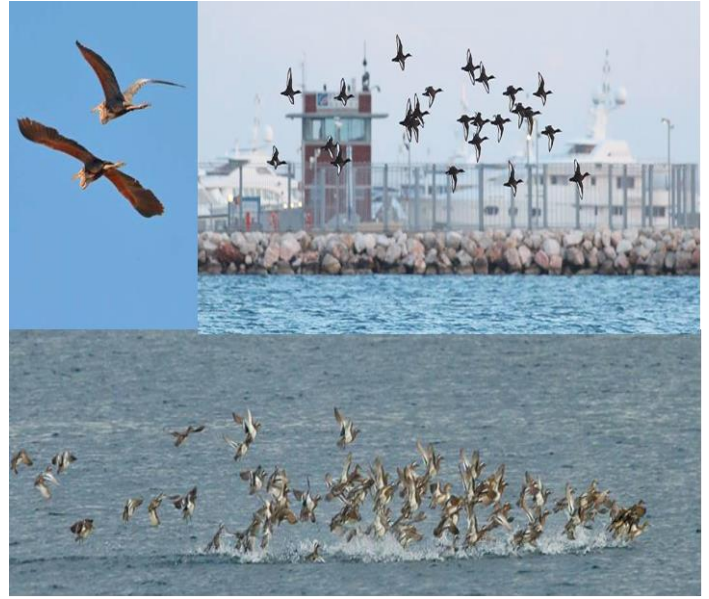
Εικόνα 7. Είδη πουλιών που έχουν παρατηρηθεί στο Δέλτα Φαλήρου.

Όπως προαναφέρθηκε, πολλά σημαντικά και απειλούμενα είδη πουλιών κάνουν την εμφάνισή τους στο Δέλτα Φαλήρου. Αναλυτικότερα, απειλούμενα είδη όπως η τουρλίδα και η βαλτόπαπια επισκέπτονται την περιοχή, ενώ και άλλα είδη συχνάζουν στον χώρο αυτό. Επίσης, πολλά είδη επωφελούνται από τις ανοιχτές άδεντρες εκτάσεις. Επιπλέον, με την εγκατάλειψη της επιχωματωμένης έκτασης μεταξύ των δυο εκβολών έχει υπάρξει και αναγέννηση της φυσικής βλάστησης. Έτσι, πολλά είδη ιθαγενών φυτών και εντόμων αποτελούν τη βάση της τροφικής πυραμίδας σε αυτό το οικοσύστημα. Τέλος, μεγάλο πρόβλημα για την ορνιθοπανίδα αποτελεί η ανθρώπινη όχληση και έτσι τα σπάνια και προστατευόμενα είδη δεν μπορούν να κατοικήσουν εκεί.