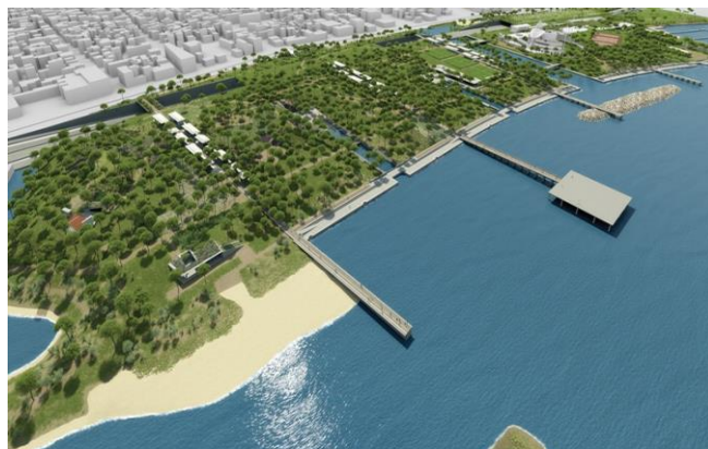
Εικόνα 15. Έτσι θα είναι ο χώρος της παραλίας του Μοσχάτου μετά την ολοκλήρωση των προβλεπόμενων σχεδίων.

Σήμερα, έχουν προταθεί στην κυβέρνηση διάφορα σχέδια για την αξιοποίηση του Φαληρικού Όρμου, μέρος του οποίου είναι και το Φαληρικό Δέλτα. Αναλυτικά, τα σχέδια προβλέπουν την κατασκευή ενός