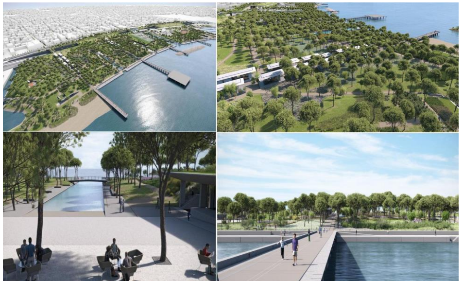
Εικόνα 18. Η υλοποίηση των σχεδίων ανάπλασης της παραλίας Μοσχάτου και του ευρύτερου Φαληρικού Όρμου θα αλλάξει πολύ την περιοχή προς το καλύτερο.