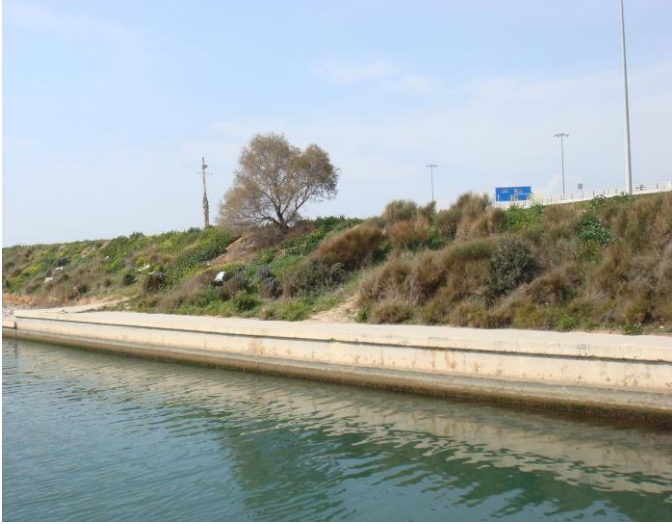
Εικόνα 16. Αν και υπάρχει στο χώρο λίγο πράσινο, η θάλασσα είναι πολύ βρόμικη.

μητροπολιτικού πάρκου, την σύνδεση του αστικού ιστού με την θάλασσα, την ολοκλήρωση των αντιπλημμυρικών έργων, την αξιοποίηση των Ολυμπιακών Ακινήτων και το σημαντικότερο την μετατόπιση της Λεωφόρου Ποσειδώνος. Μακάρι όλα αυτά τα σχέδια να γίνουν πραγματικότητα προκειμένου να βοηθηθούν τόσο το κράτος όσο και τα άτομα των γύρω περιοχών. Προς το παρόν, όμως η παραλία Μοσχάτου, ένας από τους πιο όμορφους τόπους της Αττικής παραμένει μια πλήρως ανεκμετάλλευτη περιοχή θέτοντας σε πάγο τα όνειρα εκατοντάδων κατοίκων για ένα καλύτερο περιβαλλοντικό μέλλον.