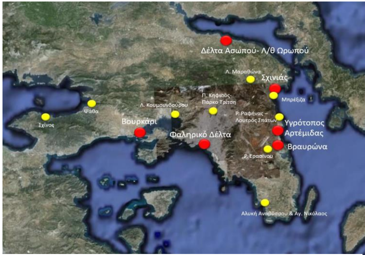
Εικόνα 4. Η παραλία Μοσχάτου αποτελεί έναν από τους πιο σημαντικούς υγροτόπους στην Αττική.

θρεπτικά συστατικά, είναι ένας ζωτικός λόγος προσέλκυσης των πτηνών. Επιπλέον, δεν θα ήταν σωστό να παραλείψουμε πως είναι η στέγη μερικών σημαντικών απειλούμενων ειδών. Συνεχίζοντας, η περιοχή αυτή αποτελεί κατάληξη όλου του δικτύου υδάτων της λεκάνης απορροής του λεκανοπεδίου, δηλαδή είναι το κλειδί για την αντιπλημμυρική θωράκιση. Ιδιαίτερη είναι και η φυσική βλάστηση του χώρου αφού δεκάδες είδη ιθαγενών φυτών και εντόμων αποτελούν την βάση της τροφικής πυραμίδας εκεί. Με την ολοκλήρωση μελλοντικών σχεδίων είναι πιθανόν ίσως να υπάρξει το φαινόμενο του οικοτουρισμού σε μεγαλύτερο βαθμό, δηλαδή διάφορες τουριστικές δραστηριότητες που συνδέονται με την φύση θα λαμβάνουν χώρα εκεί. Επιπρόσθετα, οι άνθρωποι θα μπορούν να επωφεληθούν με τη αναδημιουργία - ανάπλαση του πάρκου αφού συνήθως φαίνεται πως με αυτό τον τρόπο πλουτίζουν οι πόλεις.