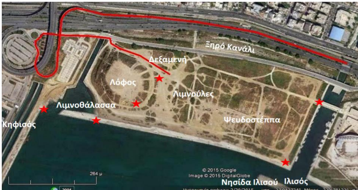
Εικόνα 1. Τωρινό σχέδιο

Σήμερα, η παραλία του Μοσχάτου είναι μια ανοιχτή περιοχή στην οποία υπάρχει περιορισμένη αναγέννηση φυσικής βλάστησης. Επίσης, εκεί έχουν καταγραφεί σπάνια είδη τόσο χλωρίδας όσο και πανίδας.