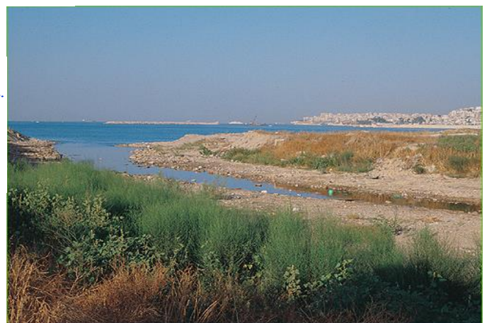
Εικόνα 6. Οι εκβολές του Γλισού στο Φαληρικό Δέλτα.